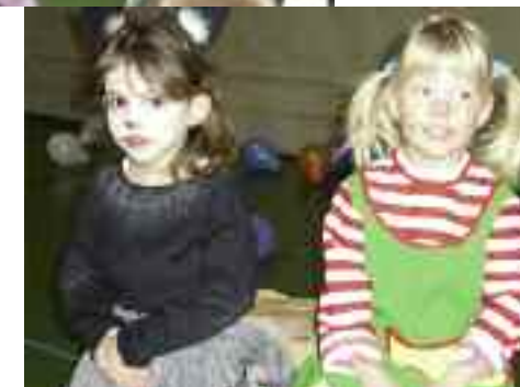
Pipi Langstrumpf und eine Maus