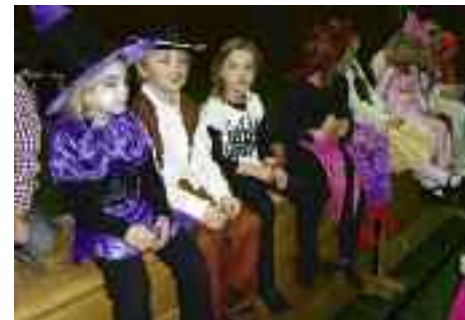
Viele bunte Kostüme schmückten die Halle