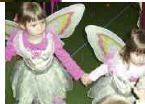
Feen und Elfen sorgten für zauberhafte Stimmung