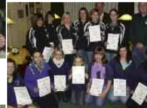
„Die geehrten Kunstradfahrer“