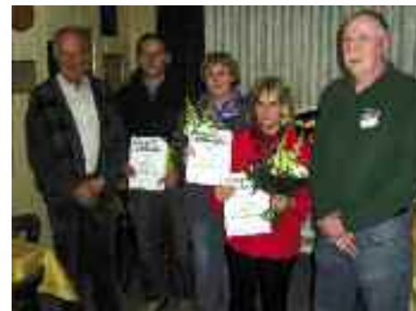
„25 Jahre im Verein“