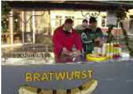
Die Griller des TuS Dorum