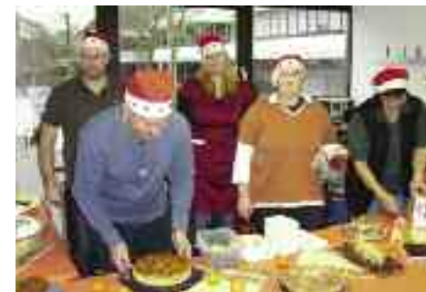
Die fleißigen Helfer am Kuchenbüffet