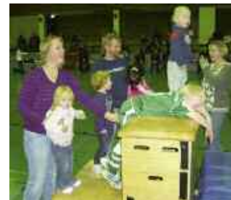
Eltern und Kinder hatten ihren Spaß