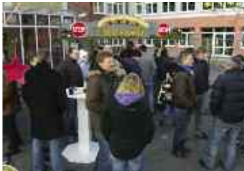
Dicht umlagert die Stände des Tus