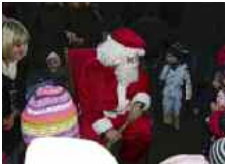
Der Weihnachtsmann beschenkt die Kinder