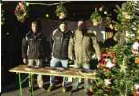
Der bunt geschmückte Getränkestand des TuS Dorum