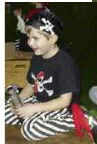
Piraten der Karibik