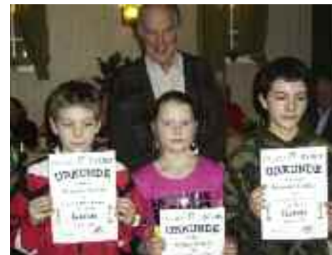
„Die erfolgreichen Karatesportler“