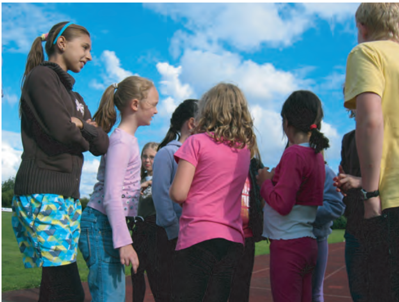
Zum Schluss waren alle Kinder Sieger und bekamen einen kleinen Preis.