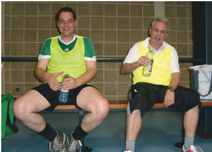
Pause!.....und da war da noch der Arschkrampf....smile