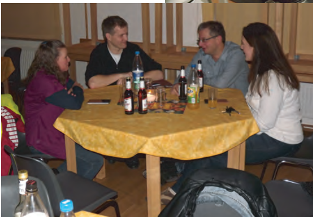
Nach dem Essen wird gefachsimpelt