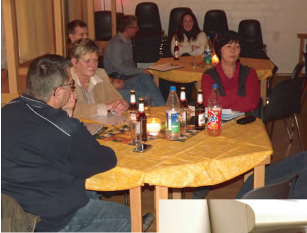
Der offiezzelle Teil