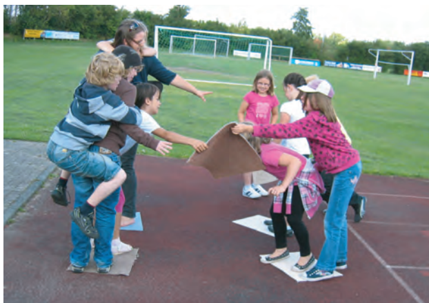
Huckepack gings einfach besser