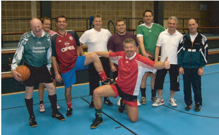
Der harte Kern...oder?

Bilder sagen mehr als Worte. Die Truppe ist einfach klasse!