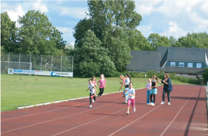
Für den Sieg legten sich alle ins Zeug.