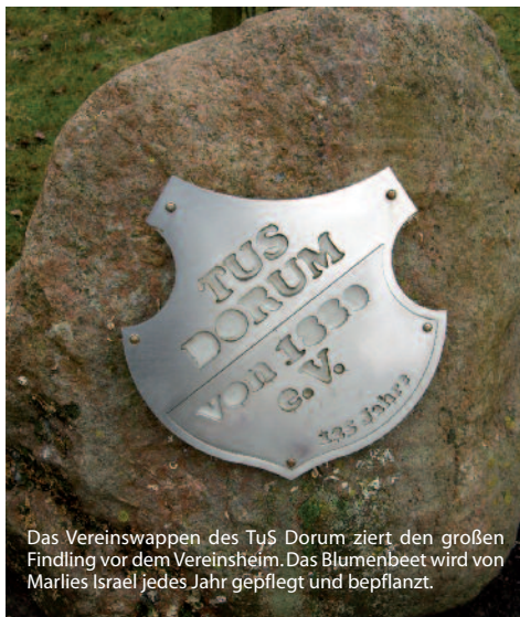
Das Vereinswappen des TuS Dorum zielt den großen Findling vor dem Vereinsheim. Das Blumenbeet wird von Marlies Israel jedes Jahr gepflegt und bepflanzt.

Er packt 20 Cent aus, wirft sie dazu und meint: „Bitte noch einen Kaffee“!