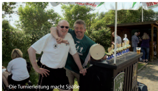
Die Turnierleitung macht Späße