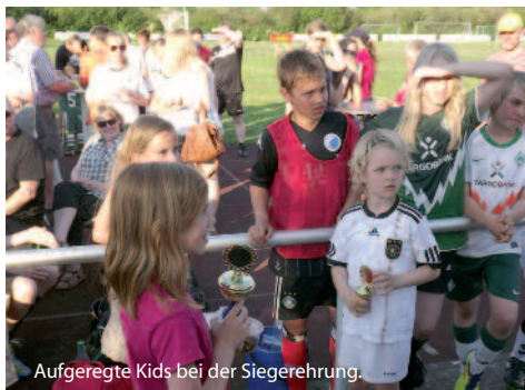
Aufgeregte Kids bei der Siegerehrung.