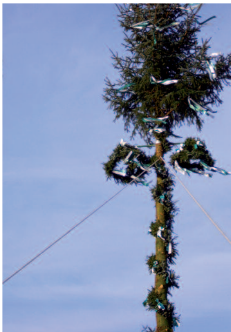
Da steht er nun in voller Pracht