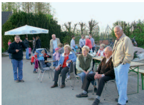
Die Kranzbinder nach getaner Arbeit.