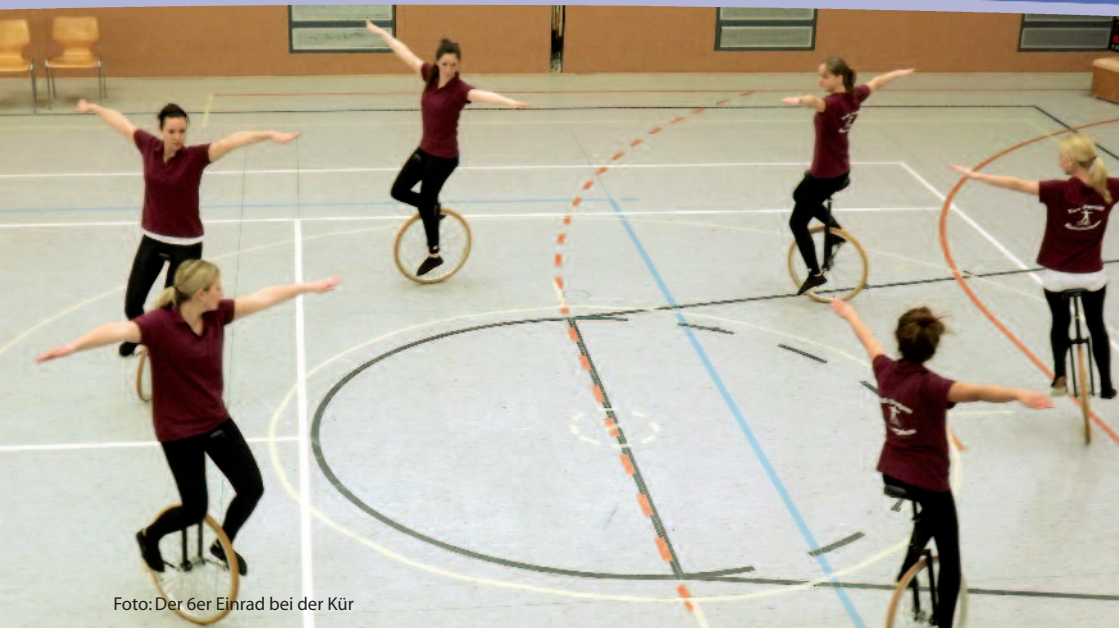
Foto: Der 6er Einrad bei der Kür