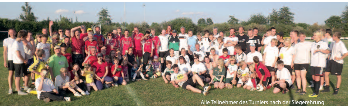
Alle Teilnehmer des Turniers nach der Siegerehrung

Das Motto lautete ja Spaß für die ganze Familie und das konnte man an diesem Nachmittag eindeutig sagen. Allein schon die Teilnahmebedingungen, dass nämlich immer ein Kind unter 14 Jahren und eine Frau auf dem Platz sein mussten, versprach Heiterkeit pur. Denn wenn ein gestandener Fußballer plötzlich von einem 10-jährigen Kind ausge-trickst wird, sieht das schon lustig aus. Oder wenn der gute Fußballer eine Frau ausspielen will und diese einfach stehen bleibt. Das führt dann zu manch komischer Slapstickeinlage. Aber so sollte es sein und niemand war ärgerlich oder gar ehrgeizig. Grätschen und böse Fouls waren verboten. Es gab nur witzige Fouls, die von den Schiedsrichtern auch so erkannt wurden. Das Turnier wurde in zwei Gruppen mit Vorrunde und anschließenden Platzierungsspielen gespielt. Auch hier war es im Grunde völlig unerheblich welchen Platz man erreichte. Am Ende bekamen alle Mannschaften Preise. Parallel zum Turnier lief ein Torwandschiessen der Mannschaften. Die Fa. Detlef Melzer GmbH hatte einen Wanderpokal gestiftet, der unter den Teilnehmern ausge-