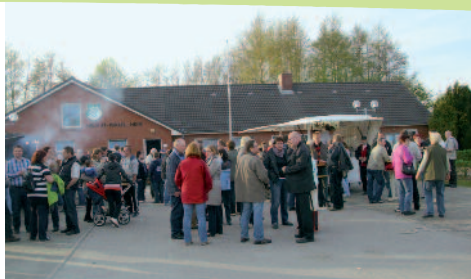
Viele Besucher waren gespannt auf den schönen Baum.