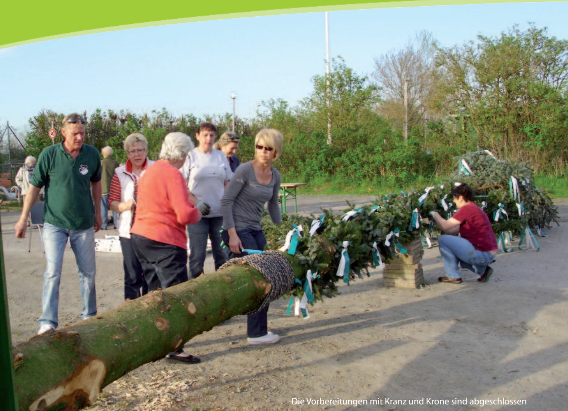
Die Vorbereitungen mit Kranz und Krone sind abgeschlossen