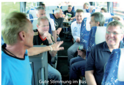
Gute Stimmung im Bus