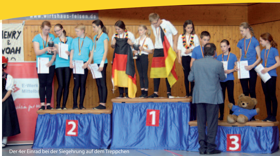
Der 4er Einrad bei der Siegerehrung auf dem Treppchen

Um so erfreulicher dafür das Abschnaider der 4er Einrad-Mannschaft. Sie fuhren einen