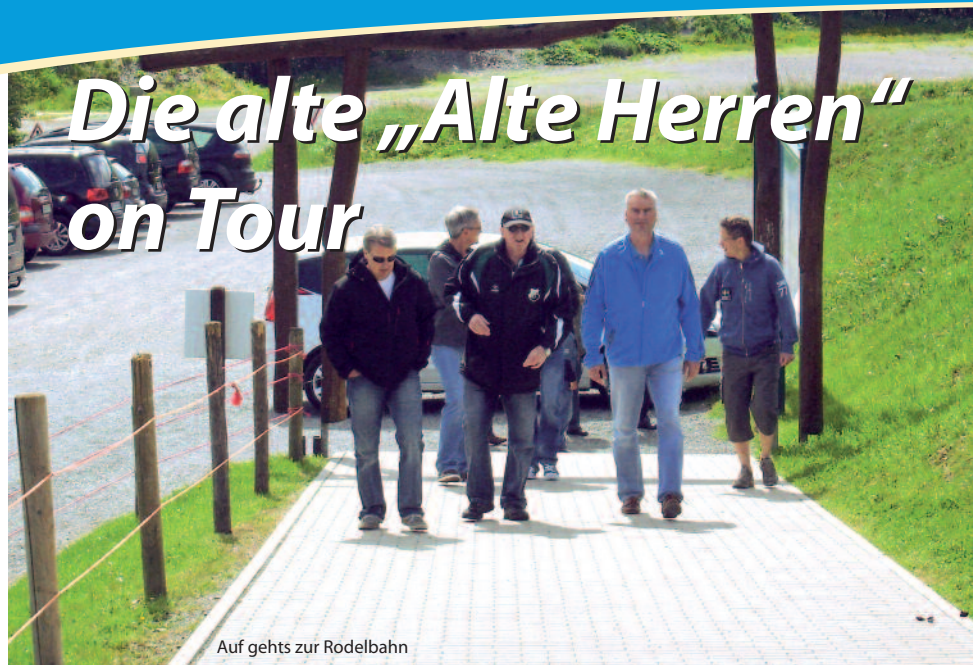
Auf gehts zur Rodelbahn