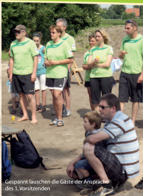
Gespannt lauschen die Gäste der Ansprache des 1. Vorsitzenden