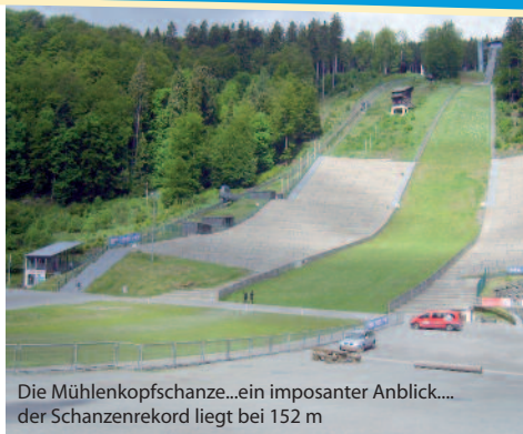
Die Mühlenkopfschanze...ein imposanter Anblick.... der Schanzenrekord liegt bei 152 m

Die Rückfahrt war dann etwas ruhiger, zumindest in den ersten beiden Stunden, da-