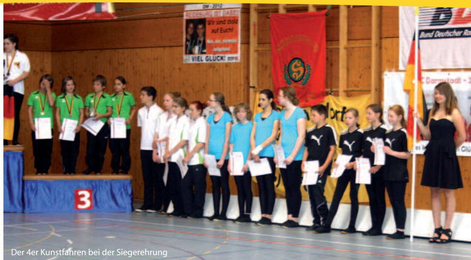
Der 4er Kunstfahren bei der Siegerehrung

Vizemeisterschaften ein Aushängeschild des TuS Dorum und der gesamten Region. Auf vielen nationalen Turnieren ist der TuS Dorum bekannt.