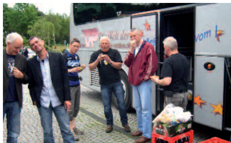
Das erste Frühstück auf dem Rastplatz