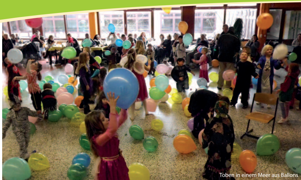
Toben in einem Meer aus Ballons

ßend durch die Aula, nichts für schwache Nerven...smile. Aber an diesem Nachmittag hatten die Kinder das Sagen.