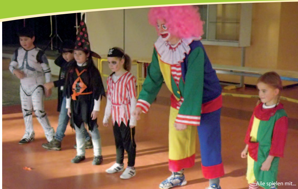
Alle spielen mit...