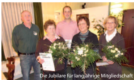
Die Jubilare für langjährige Mitgliedschaft