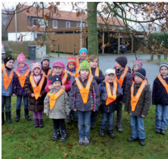
Die Laufzwerge mit neuen Warnwesten