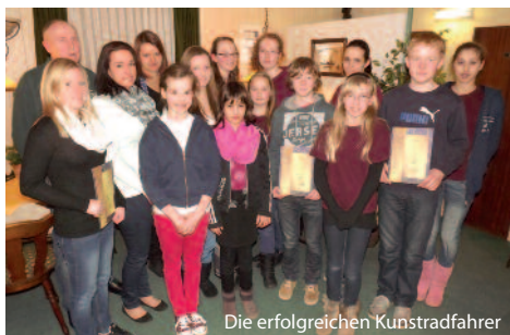
Die erfolgreichen Kunstradfahrer