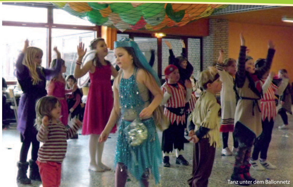
Tanz unter dem Ballonnetz

zum Feuerwehrmann und dem Polizisten. Auch Clowns und Helden sowie Pipi Langstrumpf fehlten nicht im Angebot.