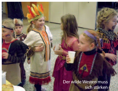
Der wilde Westen muss sich stärken

Ein buntes Treiben unter hunderten von Luftballons. Die hatte der Festausschuss unter der Decke in einem Tornetz aufgehängt welches im Laufe des Nachmittages heruntergelassen wurde. Die Kinder konnten es kaum erwarten, bis sie in Ballons badeten. Die Luftballons knallten anschlie-