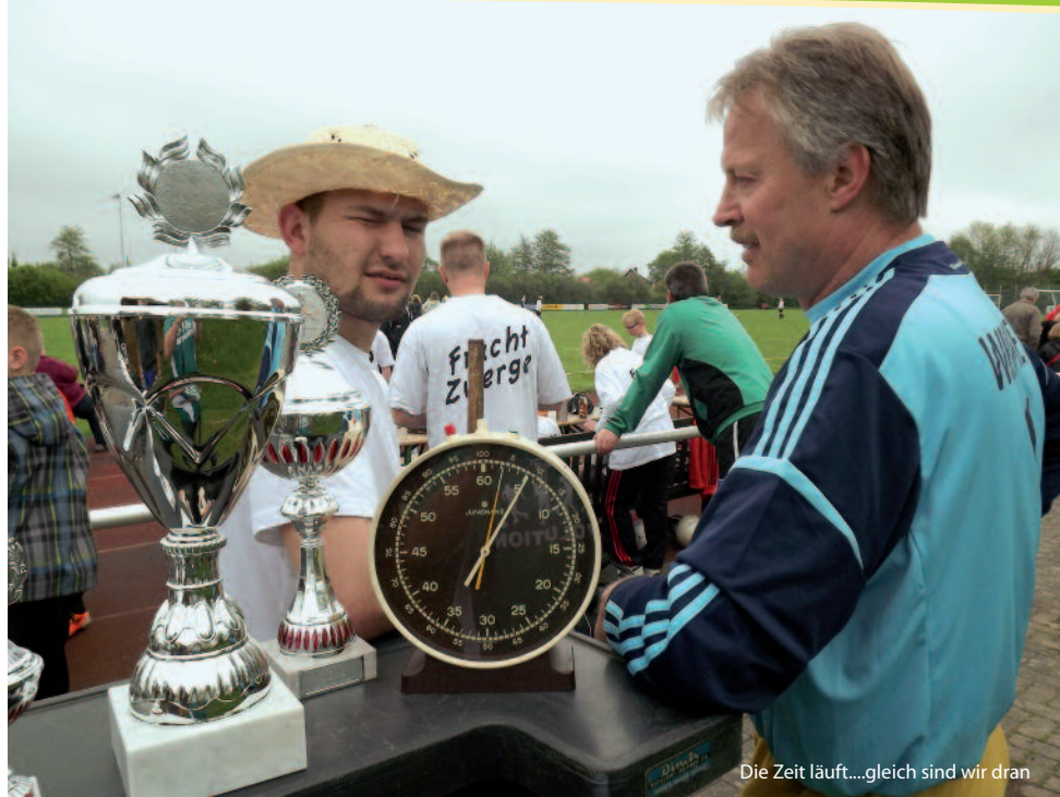
Die Zeit läuft....gleich sind wir dran

Am Ende des Turniers gab es für jedes Team einen Pokal, Getränke, Süßigkeiten und Spielsachen.