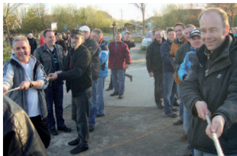
Alle Mann sind am Tau bereit

Nachdem der Baum gesichert war, ging die Party richtig los. Viele Gäste sorgten dafür, dass die Pommes sehr schnell ausverkauft waren. Dies wird sich beim nächstenmal nicht wiederholen....versprochen! Die Bratwurst schmeckte besonders lecker und viele