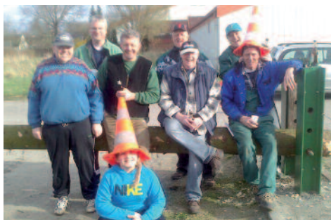
Die Ü45er nach getaner Arbeit