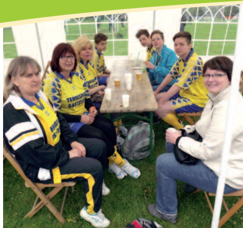
Noch wissen die RedDevils nicht, dass sie am Ende das Turnier gewinnen.