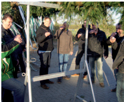
Erstmal ein kräftiger Schluck bevor es weitergeht

So....nun lag der Baum festlich geschmückt in der Halterung und auf einem Bock. Nun