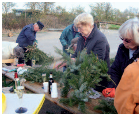
Die fleißigen Kranzbinder bei der Arbeit

Alle Beteiligten hofften nun auf besseres Wetter. Zwar war es am 30.04. trocken und auch die Sonne ließ sich zu diesem Anlass blicken, doch es war doch recht kalt. Vor dem Vereinsheim hatte der Festausschuß wieder einen Bierwagen, einen Pommestand und einen Bratwurstgrill aufgebaut. So dass alle zu ihrem Recht kamen.