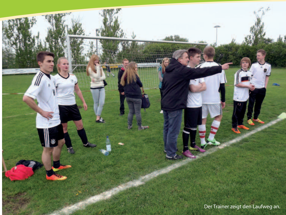
Der Trainer zeigt den Laufweg an.

gewonnen, aber an diesem Tag langte es nicht ganz bis zum 1. Platz. Diesen holte sich das Team der "Red Devils" knapp mit einem Punkt Vorsprung. Die "Red Devils" waren es auch, die mit 4 Treffern an der Torwand glänzten und auch hier den Wanderpokal gewannen. Gratulation an das Team.