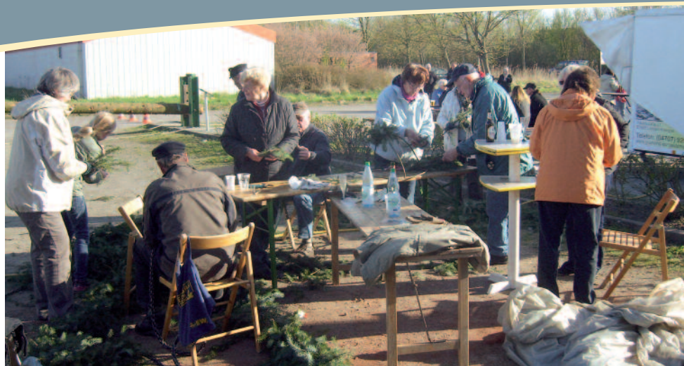
Großes Lob an die Kranzbinder