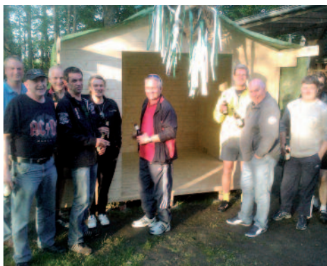
Spontan wurde Richtfest gefeiert. Die Ü 45er gaben Kalle einen aus und gratulierten zum Bau.