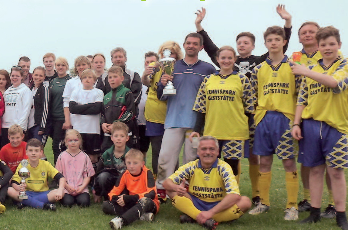
Alle Mannschaften nach der Siegerehrung

manch ein Erwachsener. Der älteste Teilnehmer war übrigens 63 Jahre und der Jüngste gerade mal 8 Jahre. Also ein wirklich bunter Haufen im positiven Sinne. Der Tag entwickelte sich zu einem richtigen Familiennachmittag, bei dem auch Oma und Opa sowie der übrige Familienanhang als Zuschauer vertreten waren.