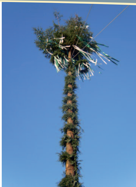
Er steht und strahlt in den blauen Himmel