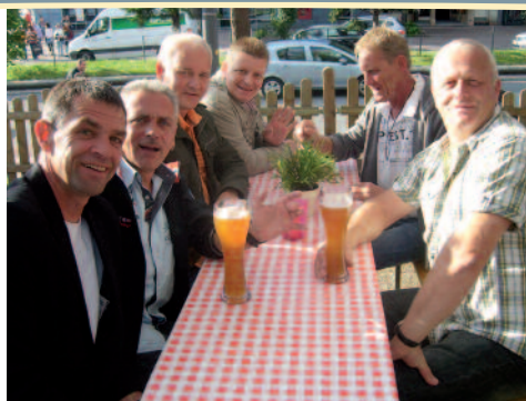
Nach soviel Kultur erstmal Pause...ach geht ja gleich weiter....