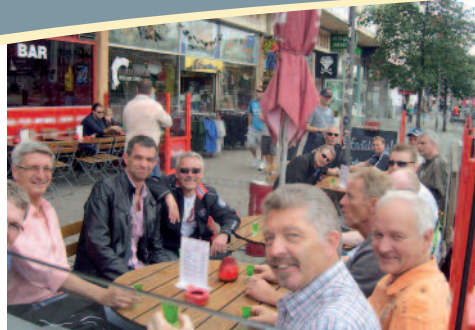
1. Pause in der Kneipe "Herz von St. Pauli"