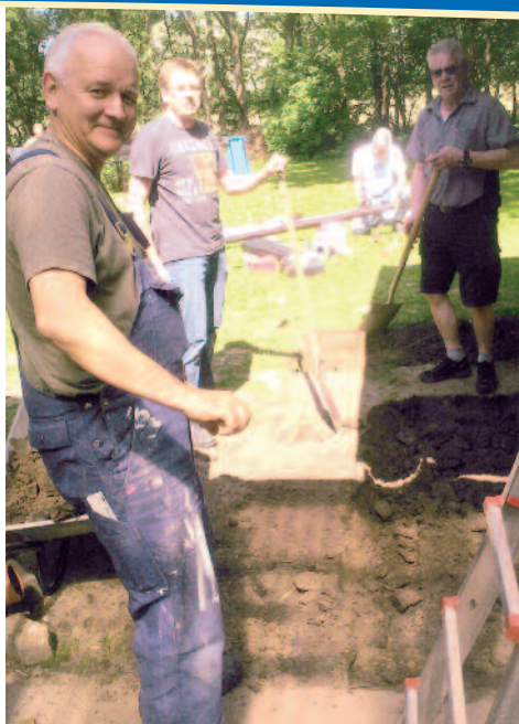
Vor dem Holzhaus wurde auch gepflastert.

Schwer, nach der Pause wieder aufzustehen.