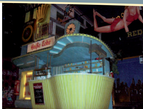
Die Bühne des Stückes "Heiße Ecke"

Erlebnis. Nach einem heftigen Gewitterschauer ging es kurz ins Hotel zum Umziehen für den Abend. Also wieder keine Freizeit...oder? Ein oder zwei Bier an der Hotelbar waren noch drin...smile.