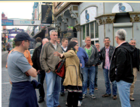
Noch ist Ruhe auf dem Kiez und die Führung nicht beendet