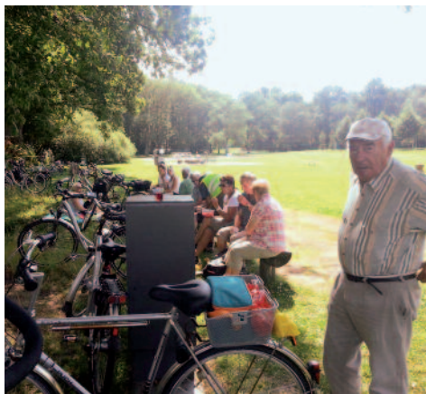
...kurze Rast und stärken!

Viele ließen sich den Kuchen halbieren; denn die Stücke waren übermäßig groß.