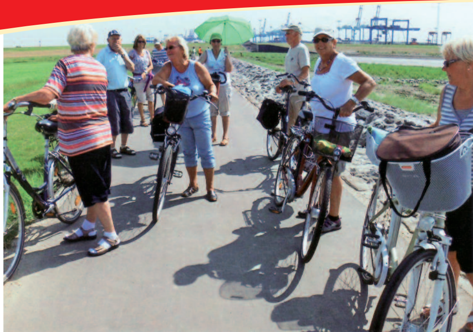
Die Tour führte an der Küste lang

Nun trat das Unglaubliche ein. Es zog innerhalb von Minuten ein Gewitter auf mit Sturmböen. Die Böen waren so stark, dass der Kaffee aus den Tassen schwappte und die Sahne vom Teller flog. Es regnete jedoch noch nicht. Einige traten aus Angst vor Schlimmerem alleine die Heimfahrt an. Was ich nicht gut finde; denn wir mussten ja alle noch nach Dorum.