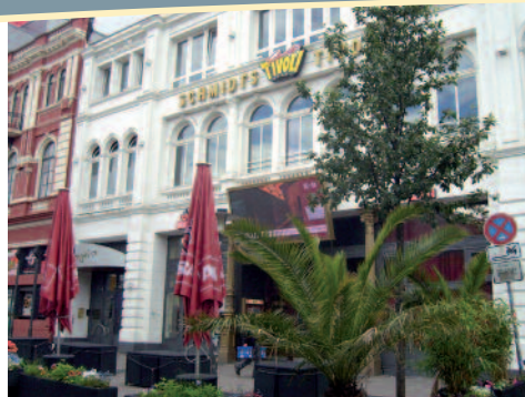
"Schmidt's Tivoli" wo wir später das Stück "Heiße Ecke" sahen

Während der Zugfahrt kamen jetzt die geistreichen und völlig unauffälligen Tricks zur Geltung. So tranken einige den Cola/Korn, was ja nun mal Nationalgetränk der Wurster ist, aus Plastikgetränkeflaschen oder Flaschen die zuvor Milchmixgetränke enthielten. Natürlich stand immer ein echtes Muster auf dem Tisch, während der Stoff mit der Plastikflasche in der Tasche war. Und natürlich gab es den allseits bekannten alkoholfreien Kümmerling, ein völlig unauffälliges Getränk. So ging es über Cuxhaven bis nach Hamburg. Die Stimmung stieg und keiner hatte was zu meckern.