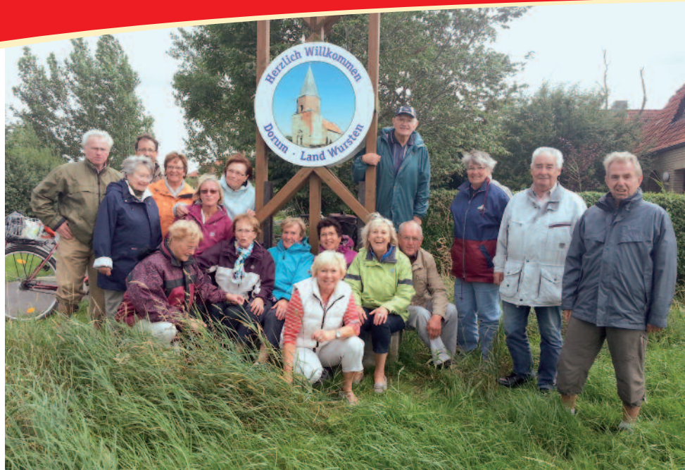
Alle Mann an Bord