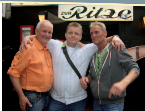
Die Tür zur "Ritze" steht auf

schlenderten an berühmten Gebäuden auf dem Kiez vorbei und erfuhren etwas über die Geschichte und einige lustige Anekdoten. „Der blaue Peter“...nein nicht unsere beiden mitgereisten Freunde, sondern eine Kiezkneipe zählte zu den Anlaufpunkten. Natürlich durfte „Die Ritze“ nicht fehlen. Hier kehrten wir ein und es gab das typische Astra zu trinken. Im Keller konnten wir sogar den berühmten Boxkeller bewundern. Fotografieren aber verboten....smile..naja.