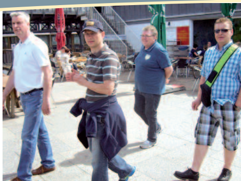
Auf geht's zur Hafenrundfahrt

eigene Gefahr erkunden. Eigentlich war um 22:00 Uhr Bettruhe angesagt, denn der nächste Tag sollte wieder sehr interessant werden, doch ich glaube wir haben den Festausschuss etwas überlisten können.