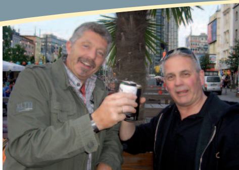
Unter Palmen auf dem Kiez