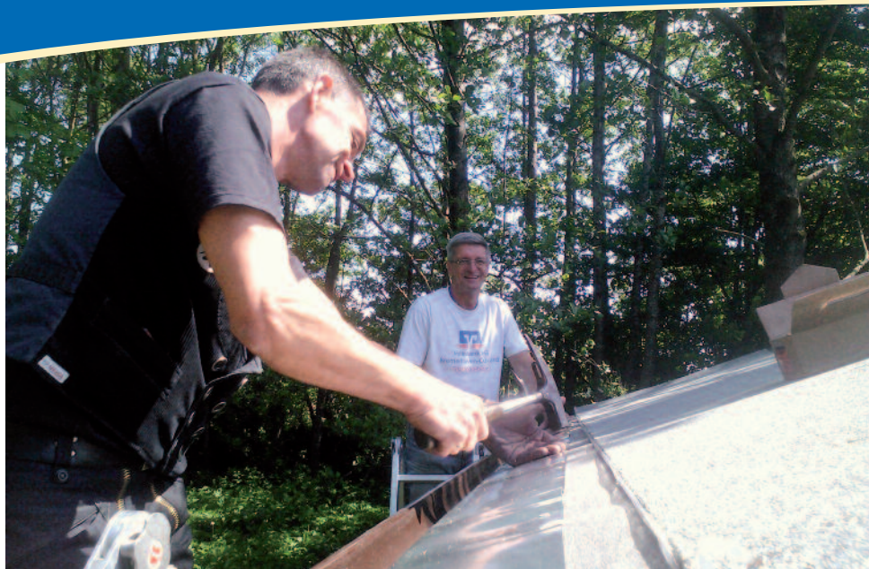
Der Meister und sein Lehrling