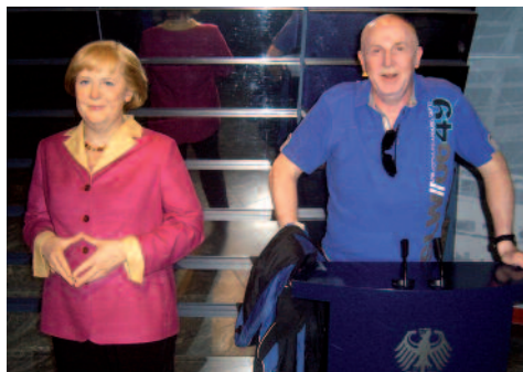
Unser „Präsi“ mit Angela im Gespräch

Unser „Präsi“ ließ es sich nicht nehmen mit Angie auf einem Foto zu sein.