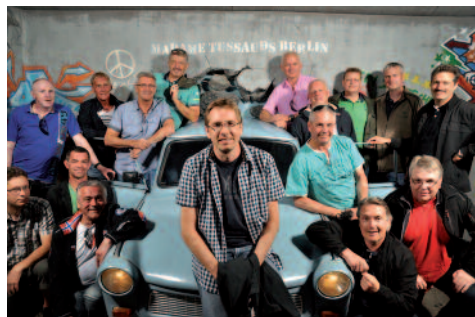
Mannschaftsfoto bei Madame Tussauds

Ziel war schließlich das Wachsfigurenkabinett von „Madame Tussaut“. Prominente aus Politik, Sport, Musik und Film wurde hier persönlich begrüßt und mit vielen ein gemeinsames Foto geschossen.