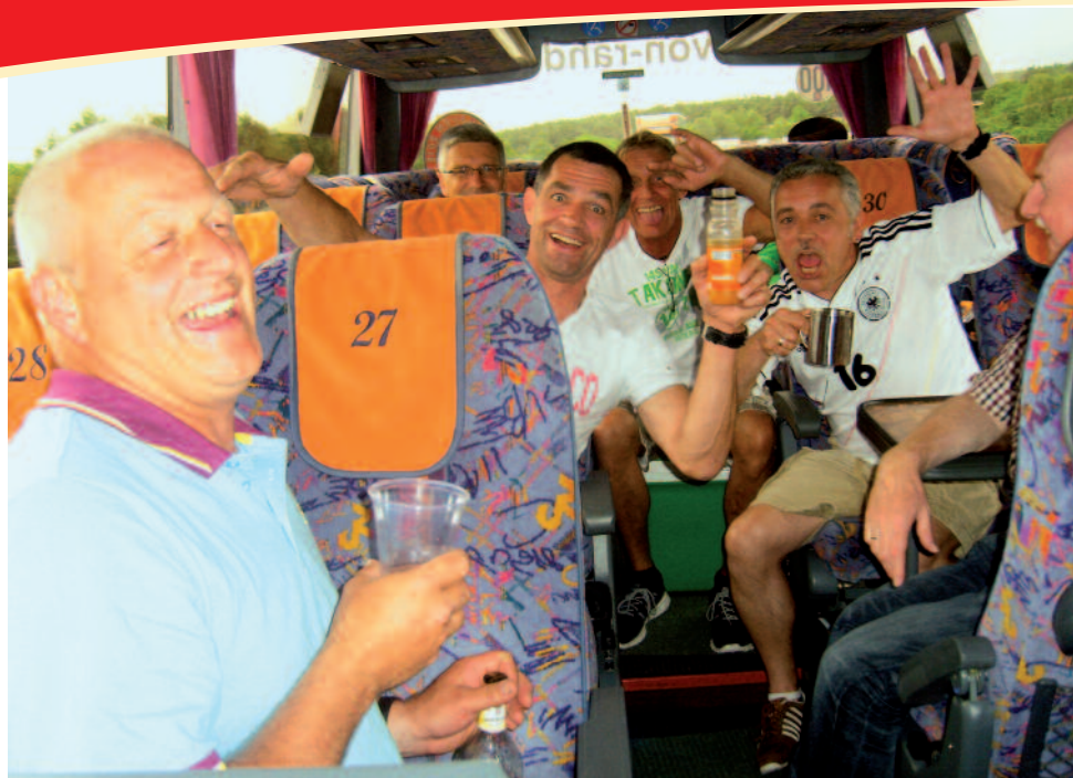
Es wurde während der Fahrt viel gelacht

der Widerstandsfähigkeit und war somit vorbeugend und gesund.