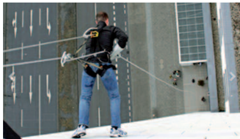
Vielleicht etwas für nächstes Jahr: „House running“

Nach ca. 3 Stunden im Kletterpark war der aktive Teil der Abschlussfahrt zu Ende. Alle Teilnehmer der „Alte Herren“ hatten den Parcours mit Bravour gemeistert. Mit hungrigem Magen machten sich, mittlerweile 10 Spieler, auf den Weg in Richtung Duhnen,