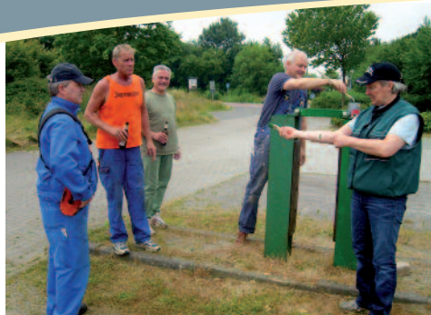
Während einer arbeit machen die anderen Pause....smile