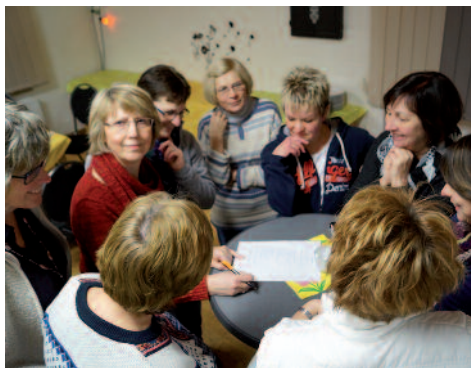
Die Frauen sind sich ziemlich sicher