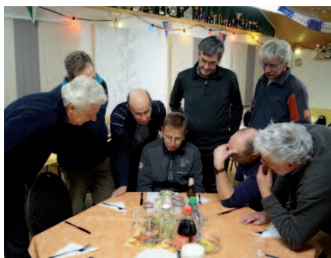
Die Männer grübeln und raten