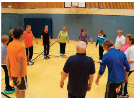
Balance zu halten ist nicht immer einfach

Aufregung legte sich aber ganz schnell, als zum Aufwärmen gleich ein Tanzspiel mit passender Musik für Heiterkeit sorgte. Anschließend wurde mit Luftballons und Fliegenklatsche Federball gespielt. Für manche eine ganz neue Erfahrung und das Schöne dabei, man war ständig in Bewegung. Das man mit Toilettenrollen kreativ sein kann, bewies das nächste Spiel. In zwei Gruppen aufgeteilt sollte eine Murmelbahn mit eben diesen Toilettenrollen gebaut werden. War schon recht amüsant was dabei so heraus kam. Als Belohnung für dieses gelungene Spiel gab es Weihnachtschokolade.