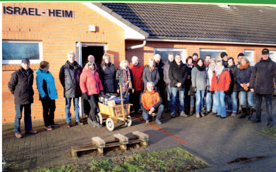
Treffen am Vereinsheim, bevor es losgeht.