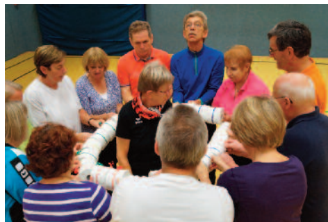
Geschicklichkeit in der Gruppe ist gefragt

Ein Staffellauf mit Holzstäben und einem Luftballon sorgte für die nächste Unterhaltung. Wie bei Spiel ohne Grenzen war die ganze Gruppe begeistert dabei. Am Ende durfte sich jeder wieder ein Stück Schokolade nehmen. Ein Wissensspiel, bei dem es um Köstlichkeiten verschiedener Städte ging sowie die lockere Runde auf dem Stabilisationskissen beendeten den amüsanten Spieleabend.