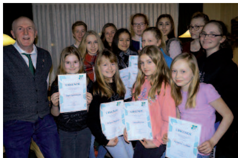
Die geehrten Kunstradfahrer des TuS Dorum

Zu Beginn wurde wie üblich ein Stimmenzähler ernannt und das Protokoll der Hauptversammlung vom 26.02.16 genehmigt. Auf das Vorlesen des Protokolls wurde verzichtet. Im Anschluss wurde an die verstorbenen Mitglieder gedacht, wobei sich alle Mitglieder erhoben und nach Jörgs Worten eine Schweigeminute einlegten.